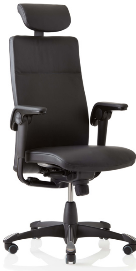
Design: Svein Asbjørnsen/sapDesign®. Patent- und Designgeschützt.